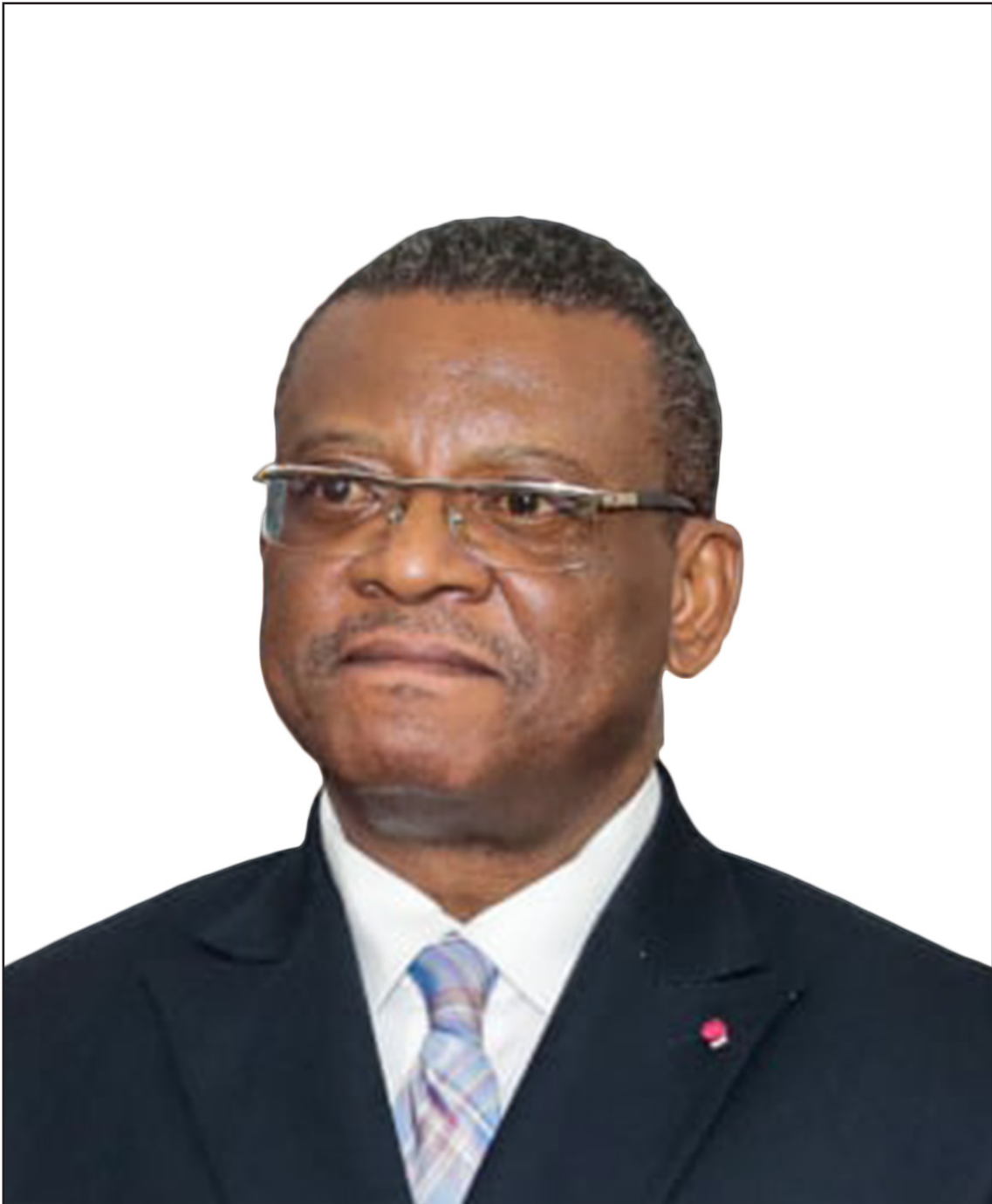
Monsieur Joseph DION NGUTE, Premier Ministre, Chef du Gouvernement