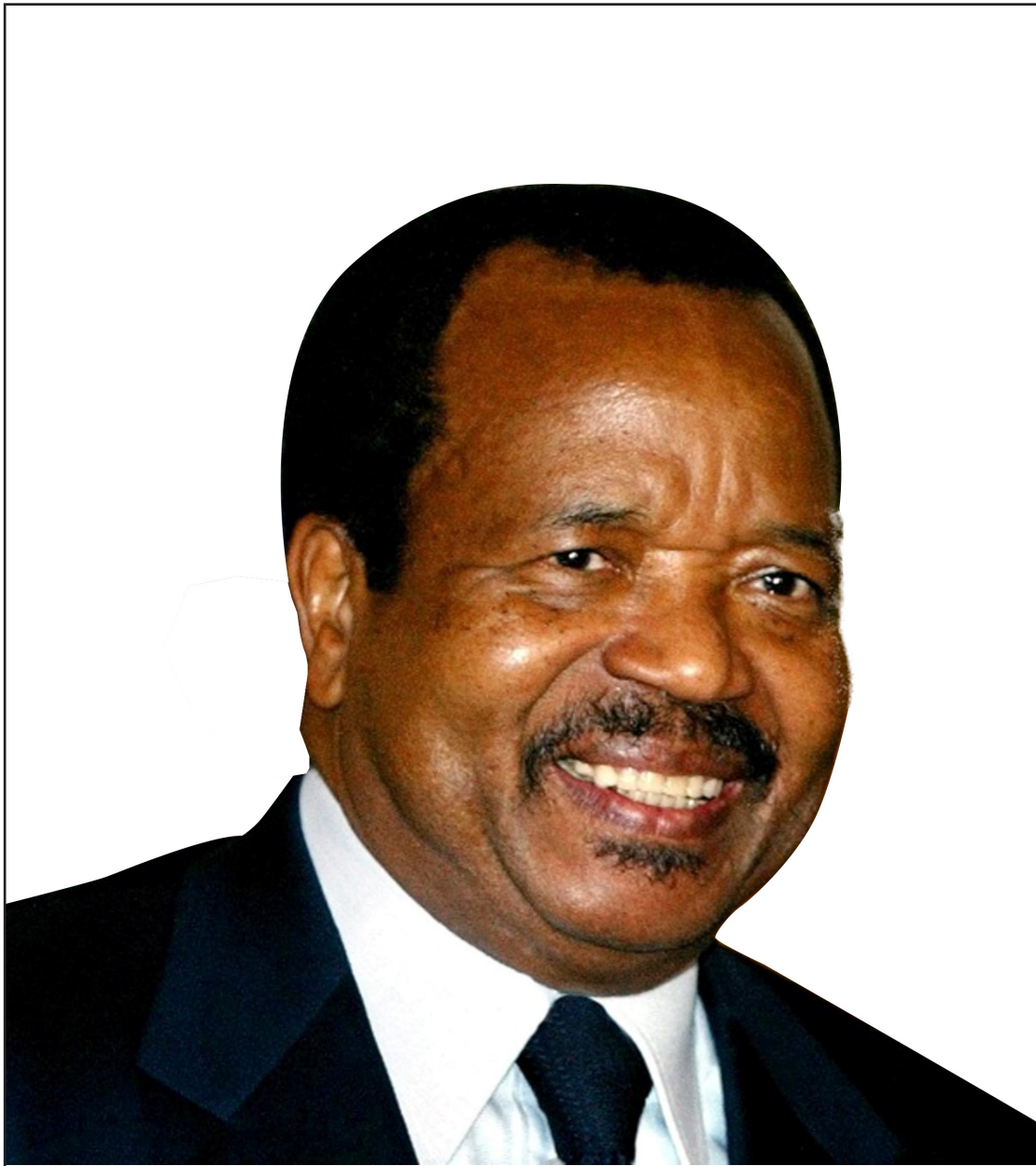
Son Excellence Paul BIYA, Président de la République du Cameroun

« Il serait souhaitable que disparaissent au sein de notre société les multiples manifestations d'incivilités, telles que les violences faites aux femmes .... » (S.E Paul BIYA, Message à la Nation, le 31 décembre 2007).