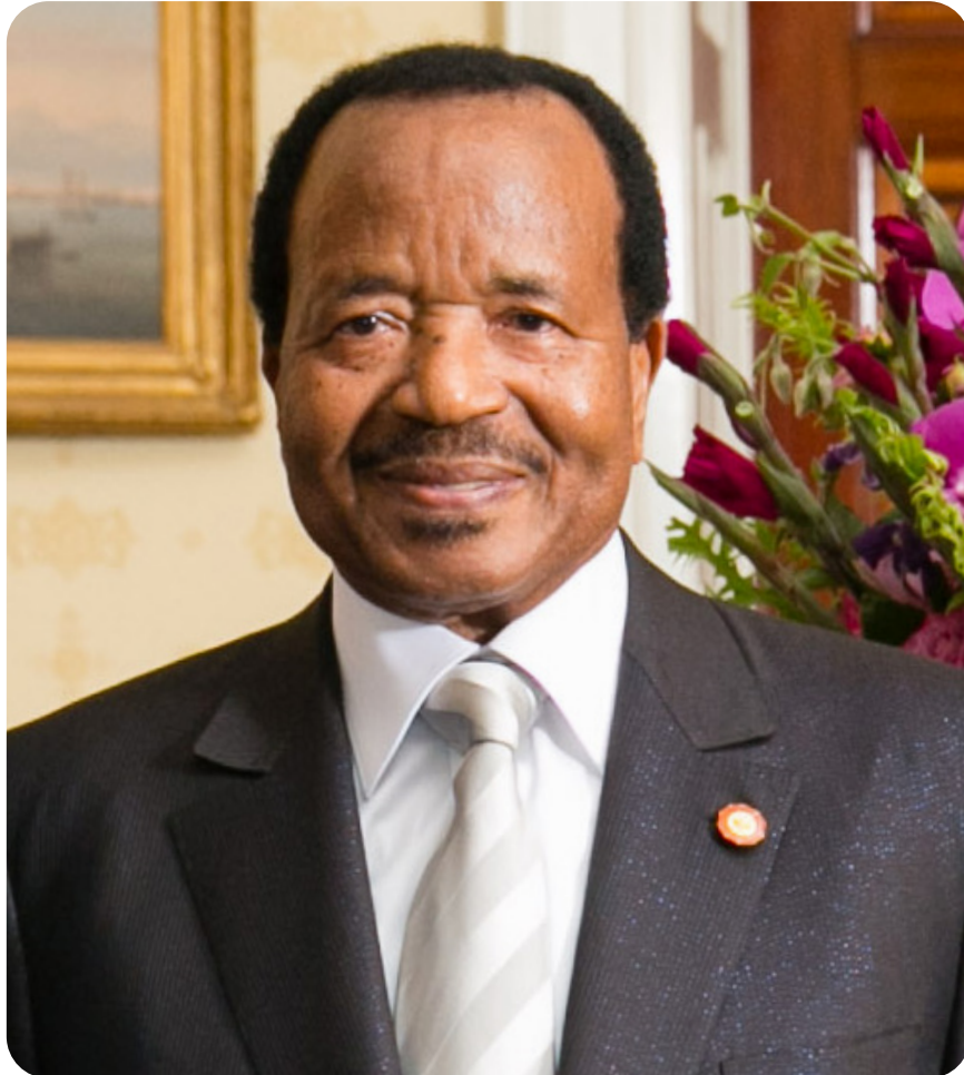
Son Excellence Paul BIYA, Président de la République du Cameroun

« ...la quête de la paix nous concerne tous... puissions-nous ensemble, prendre à bras le corps, la question de la paix et du développement durable... »