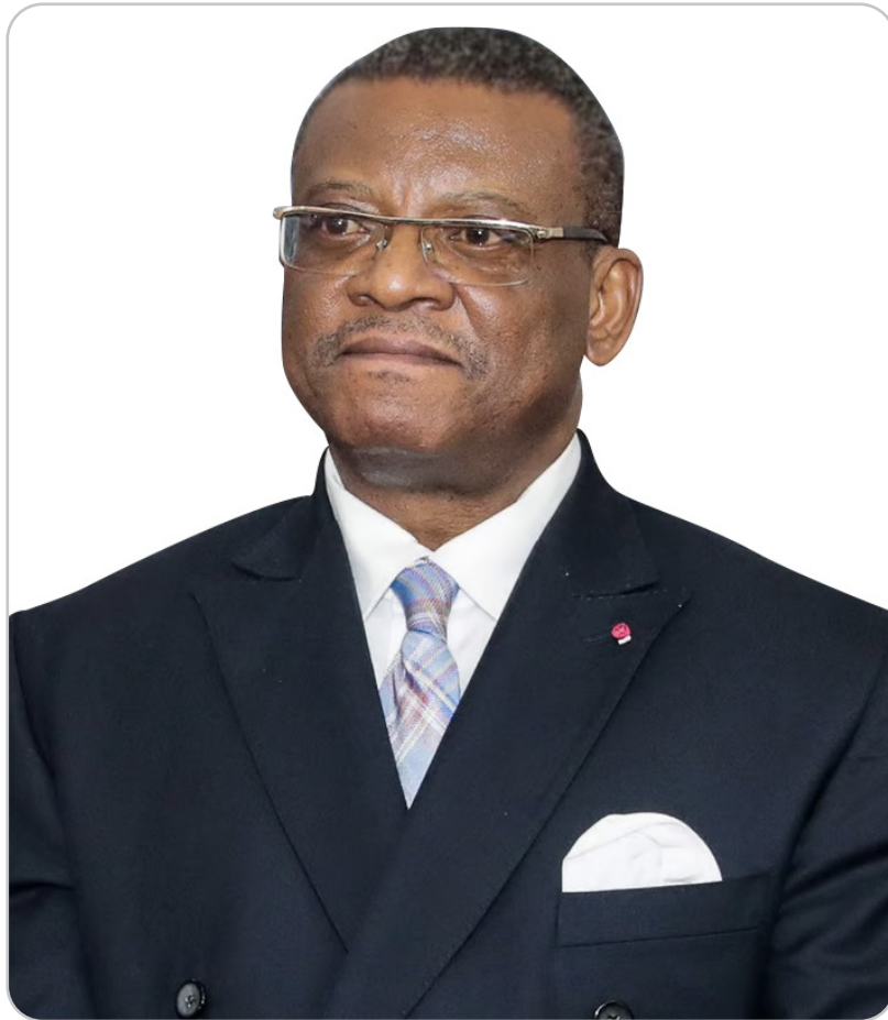
Monsieur Joseph DION NGUTE, Premier Ministre, Chef du Gouvernement