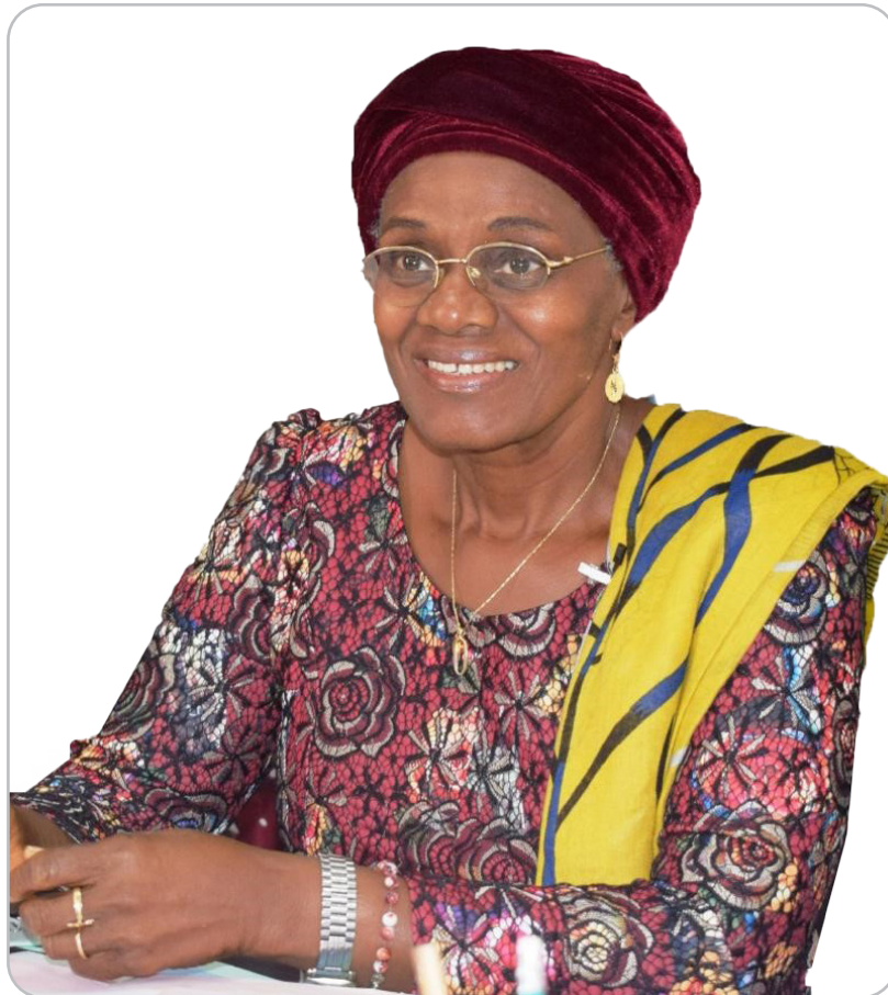
MADAME ABENA ONDOA NEE OBAMA MARIE-THERESE, MINISTRE DE LA PROMOTION DE LA FEMME ET DE LA FAMILLE