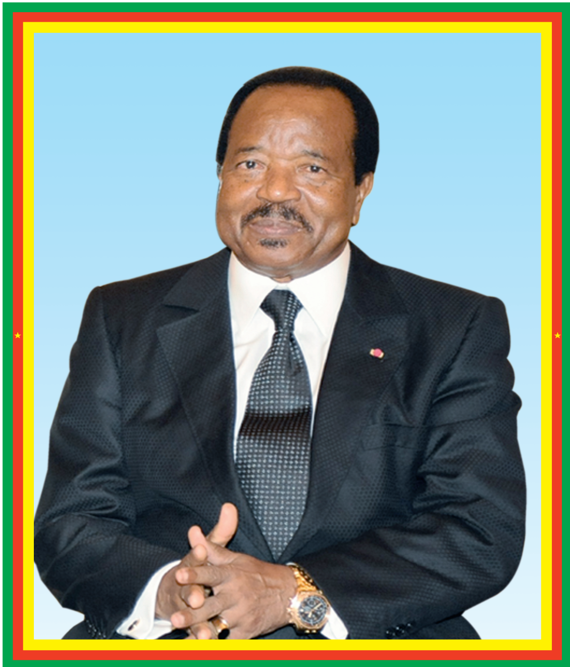
Son Excellence M. Paul BIYA Président de la République du Cameroun

« Dans le domaine de la promotion de la femme, je m'engage à veiller à l'élaboration et à la mise en route du Programme spécial d'action pour la promotion des femmes (...). Je ferai en sorte que votre travail soit partout reconnu et valorisé, je ferai en sorte que vous soyez bien représentées dans toutes les instances dirigeantes du pays. Je m'engage à faire de l'égalité entre les droits de l'homme et les droits de la femme une réalité.... »