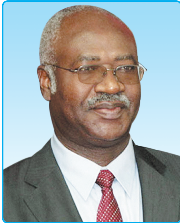
Son Excellence Philémon YANG, Premier Ministre Chef du Gouvernement