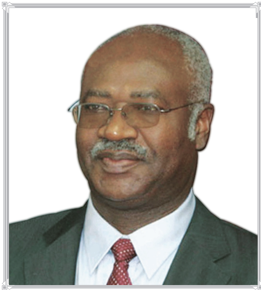
MONSIEUR PHILEMON YANG PREMIER MINISTRE, CHEF DU GOUVERNEMENT DE LA RÉPUBLIQUE DU CAMEROUN