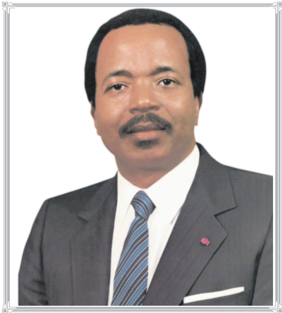
SON EXCELLENCE PAUL BIYA PRÉSIDENT DE LA RÉPUBLIQUE DU CAMEROUN CHEF DE L'ETAT