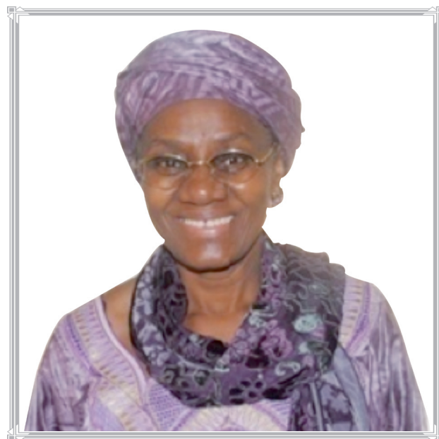
MADAME ABENA ONDOA NEE OBAMA MARIE THERESE MINISTRE DE LA PROMOTION DE LA FEMME ET DE LA FAMILLE